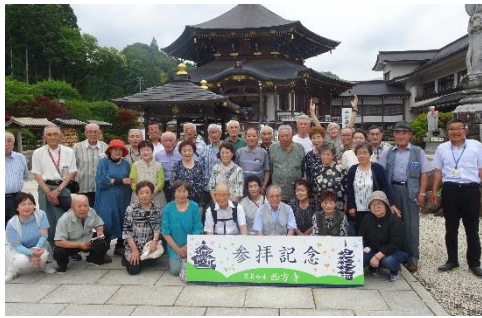
みんなで集合写真